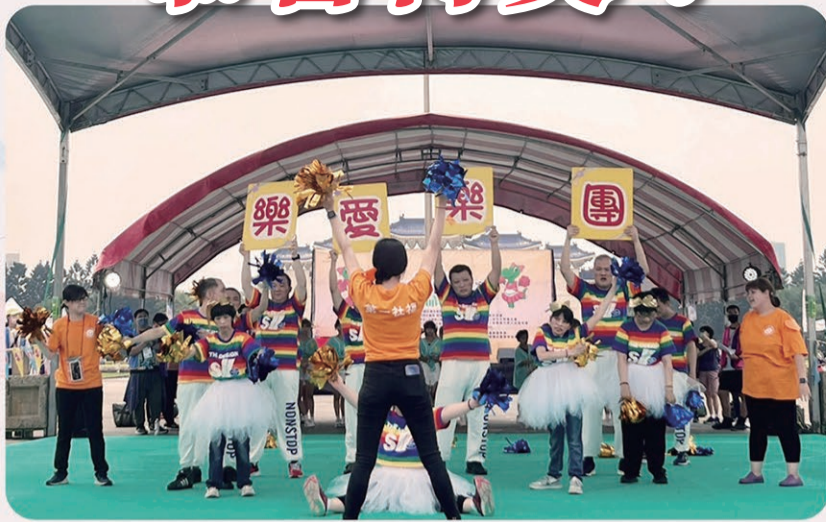
恭喜《愛立樂愛樂團》 榮獲第29屆貝樂蒂心智障礙啦啦隊比賽【特優獎】 及【最佳創意獎】