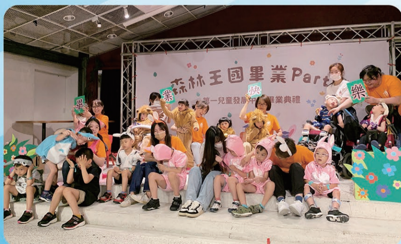
▲ 教保老師們祝畢業生畢業快樂。