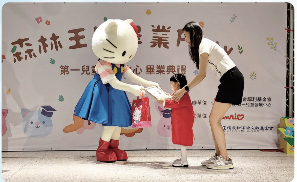
▲ Hello Kitty頒發畢業證書給畢業生。

今年7月底，「第一兒童發展中心」有15位小朋友要畢業了，其中一位將進入一般幼兒園就學，其餘的孩子都要邁入小學開始新的人生，而這也是自疫情趨緩解封後，第一社福第一個線下的畢業典禮大型活動。以往第一兒童的畢業典禮，都是擠在「第一家園」7樓，還因為空間關係，每個家庭能來的親友有限；但此次畢業典禮的場地特別搬到四四南村D館舉行，除了可運用空間變大外，第一兒童的師長們特地布置了一個展示區，展示小朋友的作品和畢業紀念冊，讓來觀禮的親友們可以更瞭解小朋友在第一兒童的日常學習及生活。