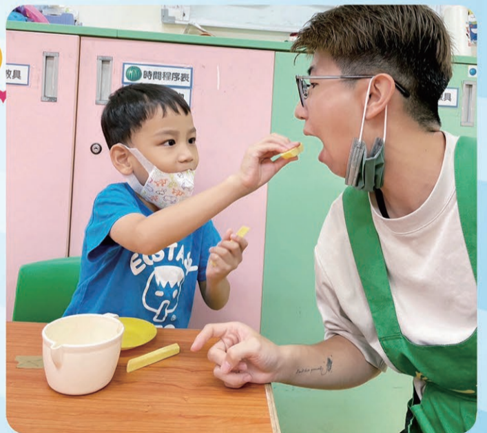
▲小餅玩扮家家酒餵老師吃薯條。