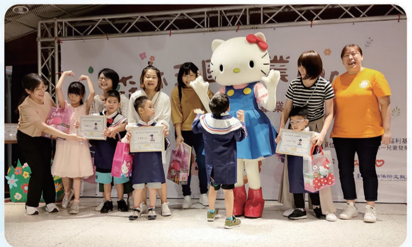
▲ Hello Kitty和畢業生及家長、執行長、中心主任一起合照。

臺灣三麗鷗因為認同第一社福為早療幼兒所做的努力，在110年捐贈Hello Kitty「愛の守護組」防疫組合，成為捐款送的禮品，與第一社福攜手為幼兒早療募集服務經費，默默地成為慢飛寶貝的守護者。這次為了鼓勵早療幼兒，台灣三麗鷗想要給小朋友一個不一樣的畢業典禮，所以請出了人氣偶像Hello Kitty來參與畢業典禮。不僅如此，還贈送畢業生每人一份小禮物，祝福他們開始人生的另一個階段。典禮開始先由執行長發表致詞，祝福畢業生未來可以飛得更高更遠；Hello Kitty的出現為活動帶來高潮，每位畢業生都收到了Hello Kitty給予的畢業證書和禮物，與會家長也很開心地和難得一見的超級偶像Hello Kitty合照，留下難忘的回憶。