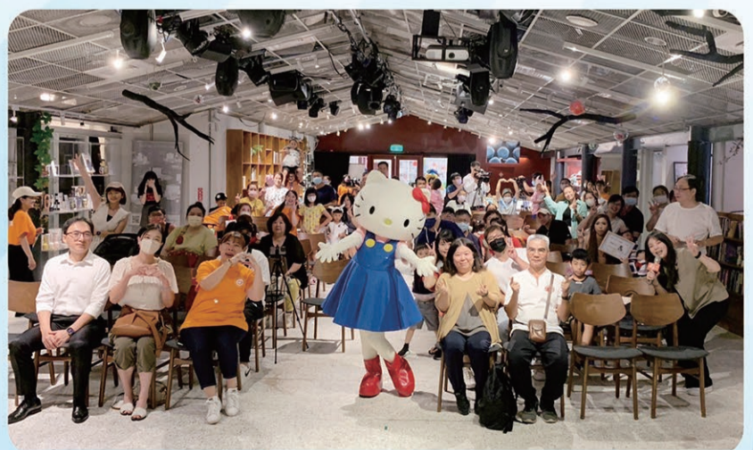
▲ Hello Kitty和與會貴賓們一起合照。