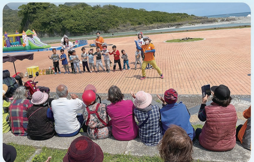
▲ 帶動唱時間，小朋友唱唱跳跳跟長輩同歡。