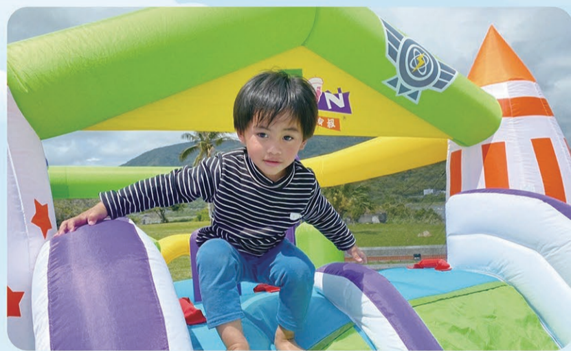
▲ 小朋友在充氣城堡上露出開心笑容。

全聯福利中心為了服務偏鄉地區的消費者，備有「行動超市車」，可讓老年人或不方便出門採買的偏鄉居民，享有平價消費又便利的服務。第一社福在執行偏鄉早療服務多年，與當地居民、幼兒園及托嬰中心互動經驗中發現，無論是家長或保育員，對於早療推動仍有不少的擔心和迷思。因此，第一社福用「行動玩具車」為媒介，以遊戲介入的方式，來發掘更多可能被忽略但卻有需要接受療育的幼兒，讓早療服務能更及時地落實介入到更多的鄉鎮。為了宣導早期療育的重要性，這次第一社福攜手全聯福利中心，以全聯「行動超市車」在花蓮偏鄉最遠的據點--靜浦社區所在地，「行動玩具車」千里迢迢從台北開了200多公里南下花蓮，結合全聯「行動超市車」，以一加大於二的力量，一起以車送愛到偏鄉。全聯佩樺基金會也準備70份營養補充品給現場參與的兒童，並設有獎徵答活動，提供豐富贈禮，邀請偏鄉兒童熱情參與。