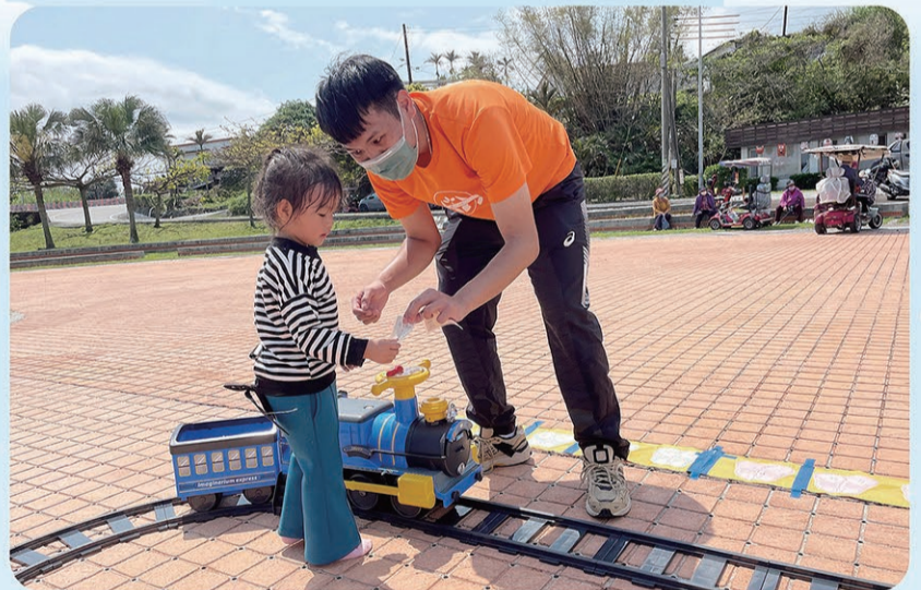
▲ 將車票給社工後就可以搭火車了。