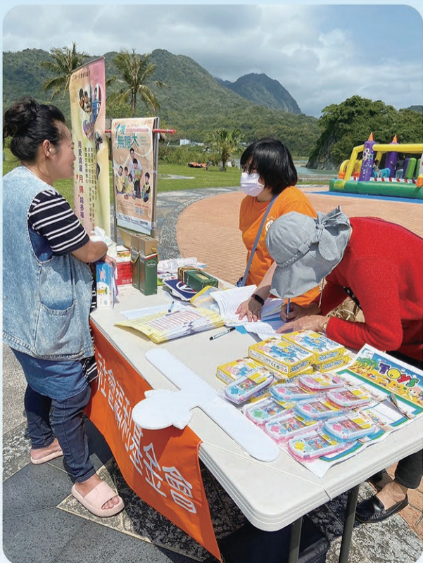
▲ 活動現場有民衆來跟社工詢問早療資訊。