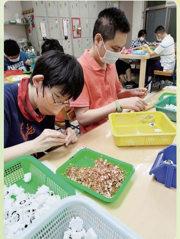
▲看似簡單的代工，每個人被分配不同的步驟，形成一個小小生產線。

這群永遠長不大的人都非常喜愛工作，也很認真看待自己的工作，我想，他們雖然沒有辦法賺大錢，但踏實度過每一天，從中獲得成就與滿足，或許就是他們快樂生活的訣竅。