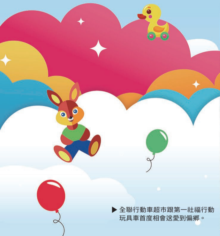
▶ 全聯行動超市車跟第一社福行動玩具車首度相會送愛到偏鄉。