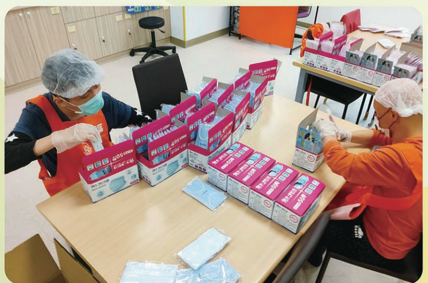
▲央北小作所的學員從事口罩包裝工作。

裝及包裝金紙跟紅包袋的速度也越來越快，品質也持續進步。在此過程中，她也越來越有信心，同時內心萌生了想要再次到職場工作的念頭。