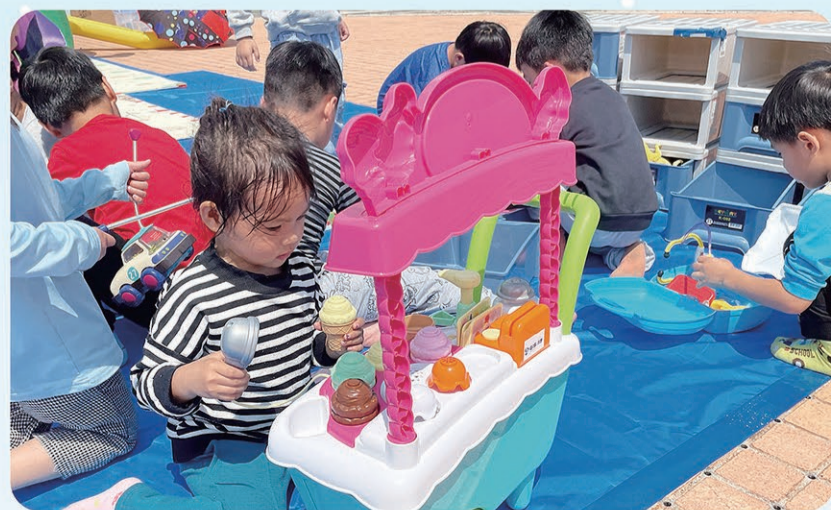
▲ 今天我是冰淇淋攤車的小老闆。