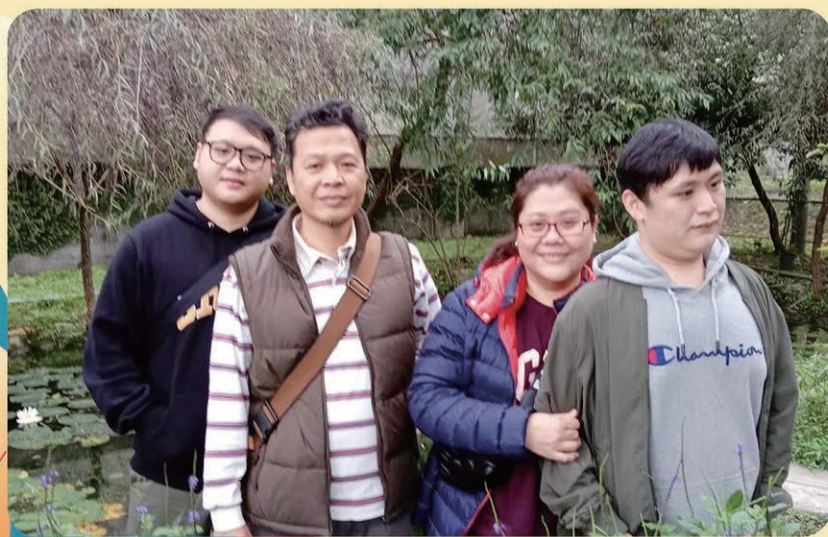
▲ 跟家人一起出去玩最開心。