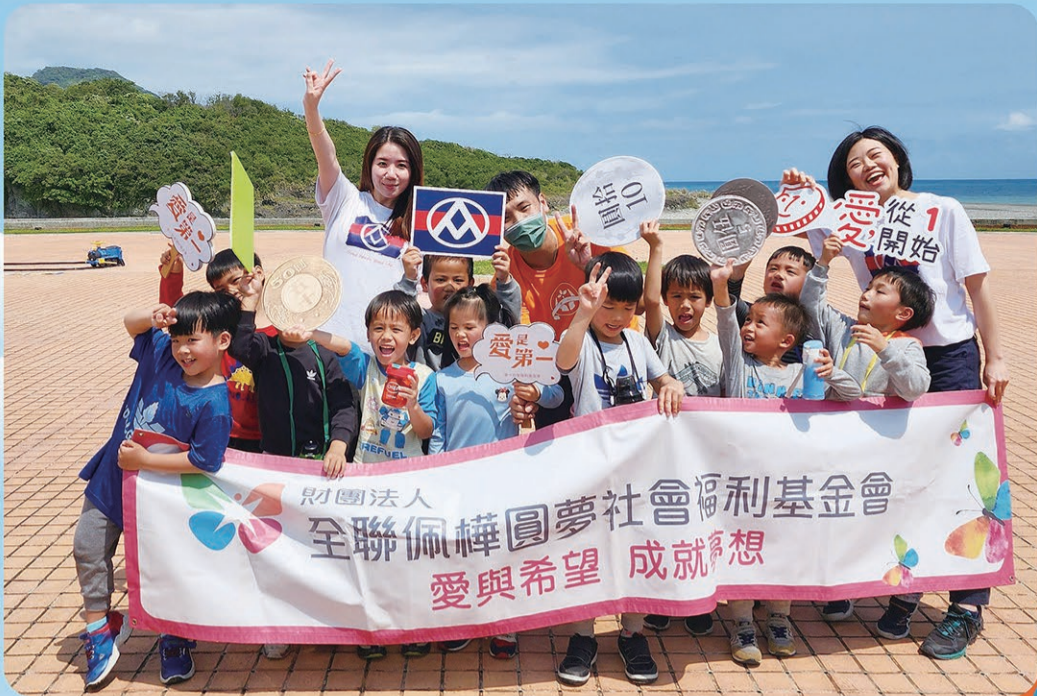
▲ 全聯佩樺基金會也準備70份營養補充品給現場參與的兒童。