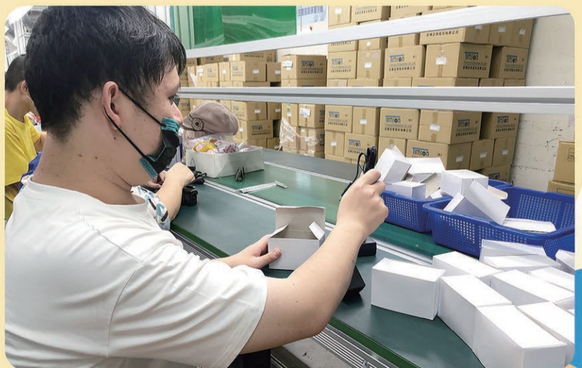
▲ 跟著工作隊去西柏工廠工作。